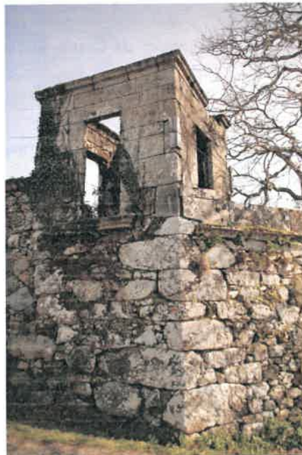
Figura 8 – Mirante de cúpula da Casa do Outeiro

Deste conjunto arquitetónico fazem ainda parte os vestígios de um mirante de cúpula e um moinho.