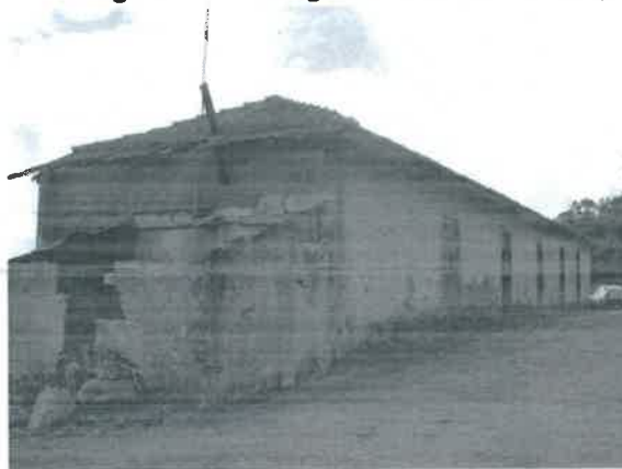
Figura 11 – Antiga Fábrica da Manteiga

de manteiga de Agualonga, que se encontrava registada com o n.º 788/44 na Direção Geral dos Serviços Pecuários, com clientes em Melgaço, Porto, Coimbra, Leiria, etc.