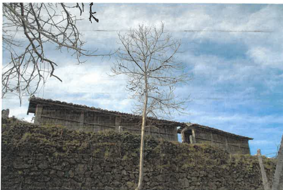
Figura 6 – Espigueiros da Casa do Outeiro

Esta casa, de grande importância económica, tinha como atividade predominante a função agrícola, que se evidencia pela extensão de dois espigueiros.