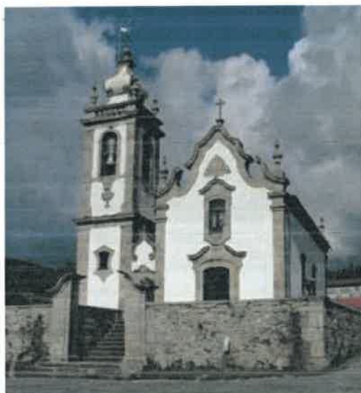
Figura 12 – Igreja Paroquial de Agualonga