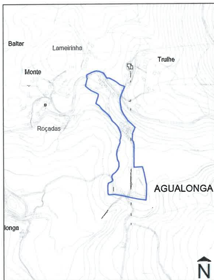
Figura 1 - Proposta de delimitação da ARU da Casa do Outeiro