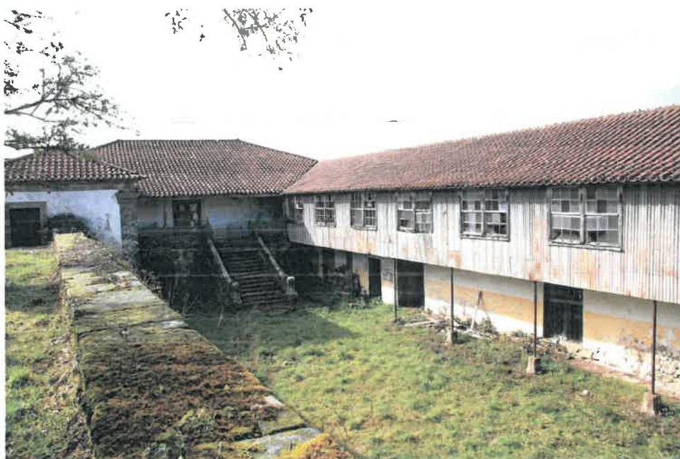
Figura 5 – Casa do Outeiro