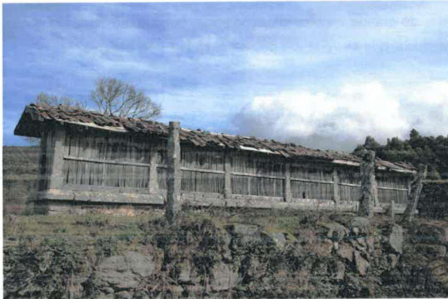
Figura 7 – Divisão do espigueiro em quarteirões