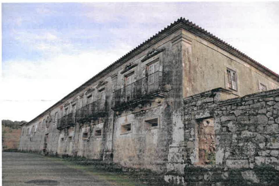
Figura 4 – Frente de rua da Casa do Outeiro