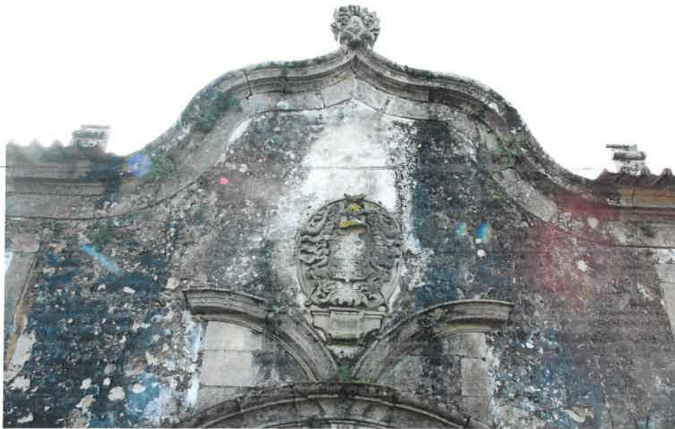
Figura 2 – Brasão da Casa do Outeiro