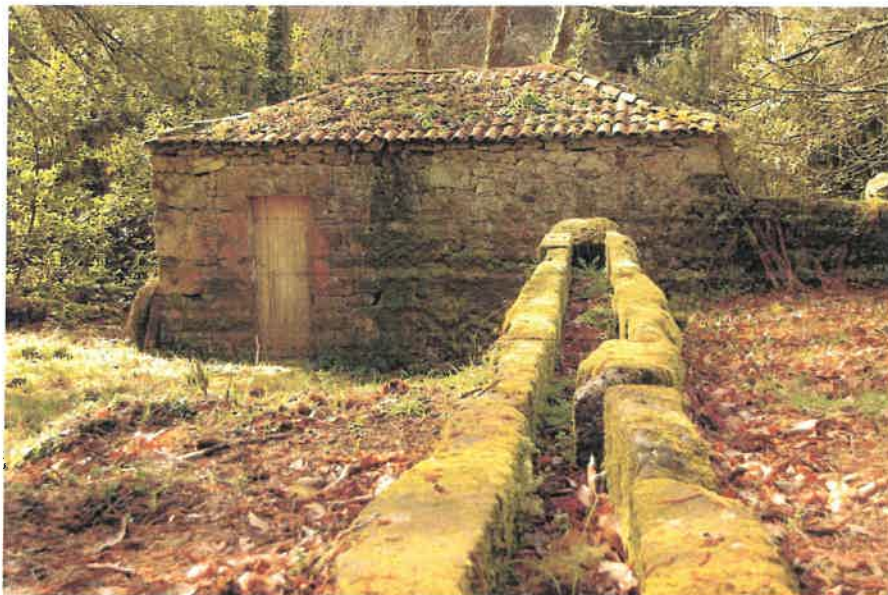
Figura 9, 10 – Moinho da Casa do Outeiro