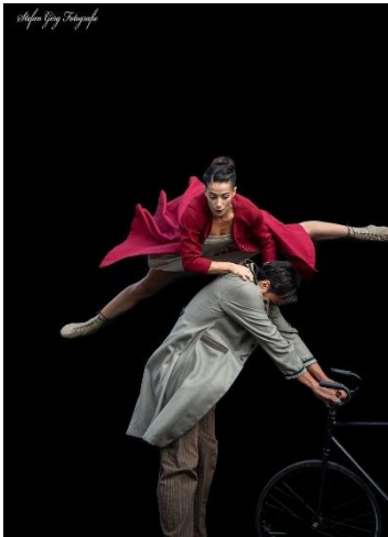
Duo Kaos - Itália Time To Loop

O espetáculo que cabe numa mala de viagem faz-se de dança contemporânea, hip-hop e acrobacia em torno de um sofá e da palavra grega kairós, que remete para o desafio do tempo e da oportunidade – fazer a coisa certa no momento certo. Uma enérgica performance feita de precisão, que convida o público à redescoberta da acrobacia como linguagem corporal.