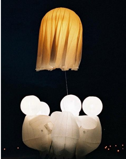
Compagnie Des Quidams - França Herbert's Dream

criando uma viagem poética que encantará espectadores de todas as idades. Ao longo de uma sucessão de cenas repletas de fantasia e humor, o público mergulha num mundo de bolhas gigantes, reflexos e cores, onde tudo é possível. A interação constante com o público torna cada apresentação numa experiência irrepetível, em que crianças e adultos se deixam levar pelo encantamento e pelo riso. Venha descobrir o universo mágico de “Man In Bubble”, onde a poesia visual e a diversão se fundem em perfeita harmonia.