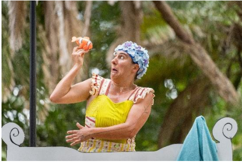
Companhia A Nariguda – Portugal Splash! Um banho invulgar

Neste divertido espetáculo de comédia visual assistimos a um invulgar e cómico banho de banheira, onde não faltam surpresas e hilariantes momentos de loucura clownesca. Dona Presumida é uma mulher de hábitos especiais... Gosta de tomar o seu banho de banheira com borbulhas de champanhe e muitas aventuras! Um número que promete levar-nos por banhos nunca antes navegados!