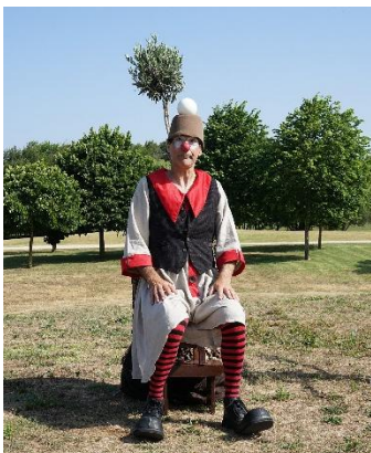
Nuvem Voadora – Portugal Paraíso (Estreia)

Como uma piscadela à lua. Como num sonho!