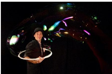
Bubble On Circus - Itália Man in a Bubble

Time to Loop é uma história de movimento, transformação e amor, onde construir e destruir fazem parte da mesma equipa e cada personagem, à sua maneira, procura apoios e complementos para trazer o caos de volta à harmonia. Tudo isto é um jogo síncrono, porque o equilíbrio é uma constante que nos leva a sair dos nossos próprios limites, a romper e a levantar as possibilidades de adesão, ligação e desprendimento necessárias para iniciar uma nova ação. Com leveza de espírito e impulso romântico, as duas personagens começam a entender que um não pode substituir o outro, mas que juntos podem criar o loop perfeito.