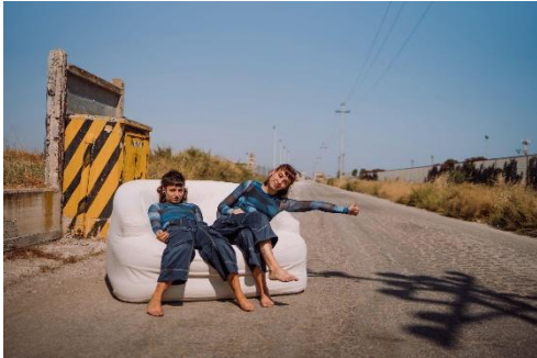
Companhia FIKA – Portugal/França Kairós

O espetáculo que cabe numa mala de viagem faz-se de dança contemporânea, hip-hop e acrobacia em torno de um sofá e da palavra grega kairós, que remete para o desafio do tempo e da oportunidade – fazer a coisa certa no momento certo. Uma enérgica performance feita de precisão, que convida o público à redescoberta da acrobacia como linguagem corporal.